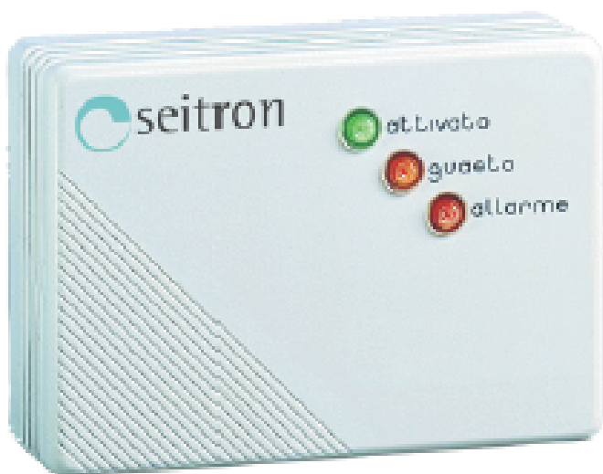
Рис1. Внешний вид