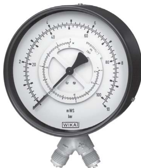
Дифференциальный манометр Модель 711.11